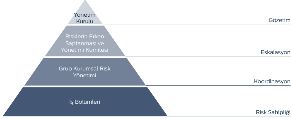
Şekil 2: Türk Telekom Grubu Kurumsal Risk Yönetimi Yönetişim Yapısı